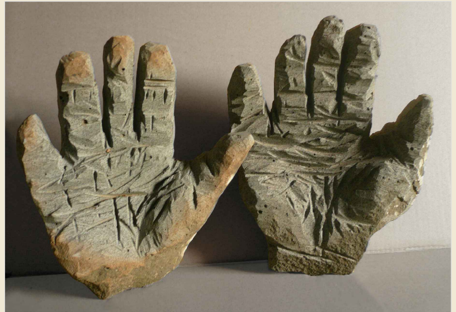
Mani - Sculture di Pinuccio Sciola

PROMOZIONE DI INTERVENTI DI VALORIZZAZIONE A FINI TURISTICI DELL'ATTRATTIVITÀ DEI SISTEMI PRODUTTIVI IDENTITARI E TRADIZIONALI DEI CENTRI MINORI