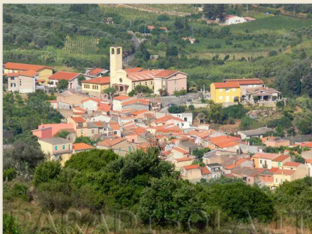
Veduta panoramica di Modulo