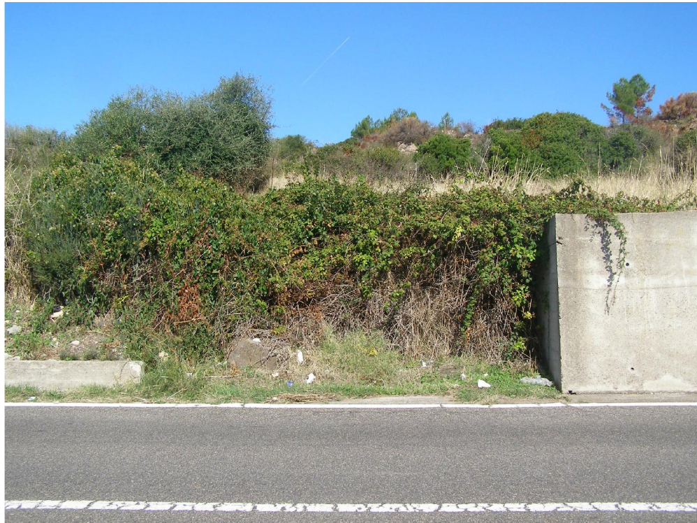
Foto 1 - Vista dell'accesso allo stradello dalla Strada Statale 129 bis