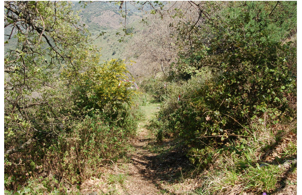
Foto 9 - Vista dello stradello invaso da piante infestanti