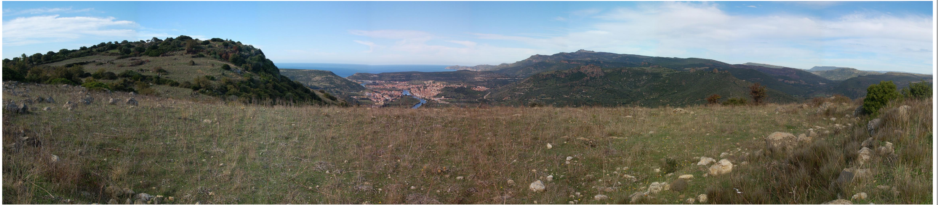
Foto 5 - Vista dell'area panoramica (si scorge in lontananza la città di Bosa)