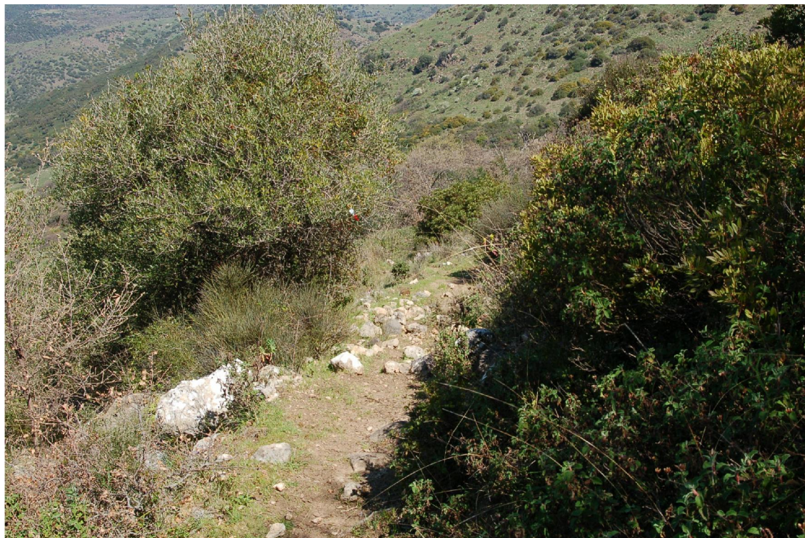
Foto10 - Vista dello stradello nel tratto a mezza costa