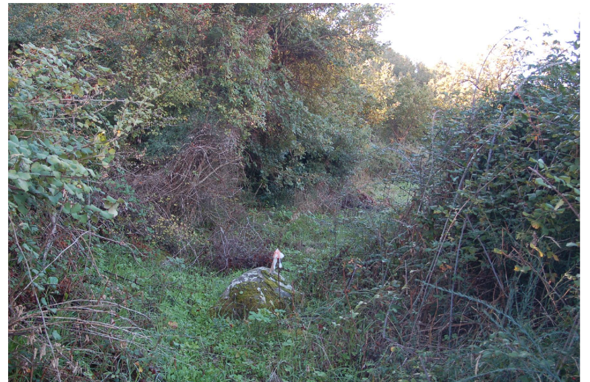
Foto 15 - Vista dello stradello nell'ultimo tratto prima della fonte invaso da rovi