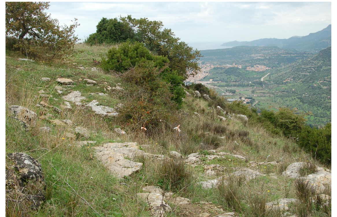
Foto 7 - Vista della pavimentazione lapidea in prossimità del tornante