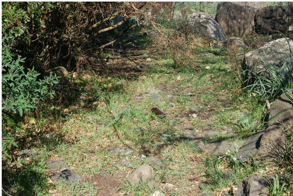
Foto 3 - Vista della pavimentazione lapiadea dello stradello