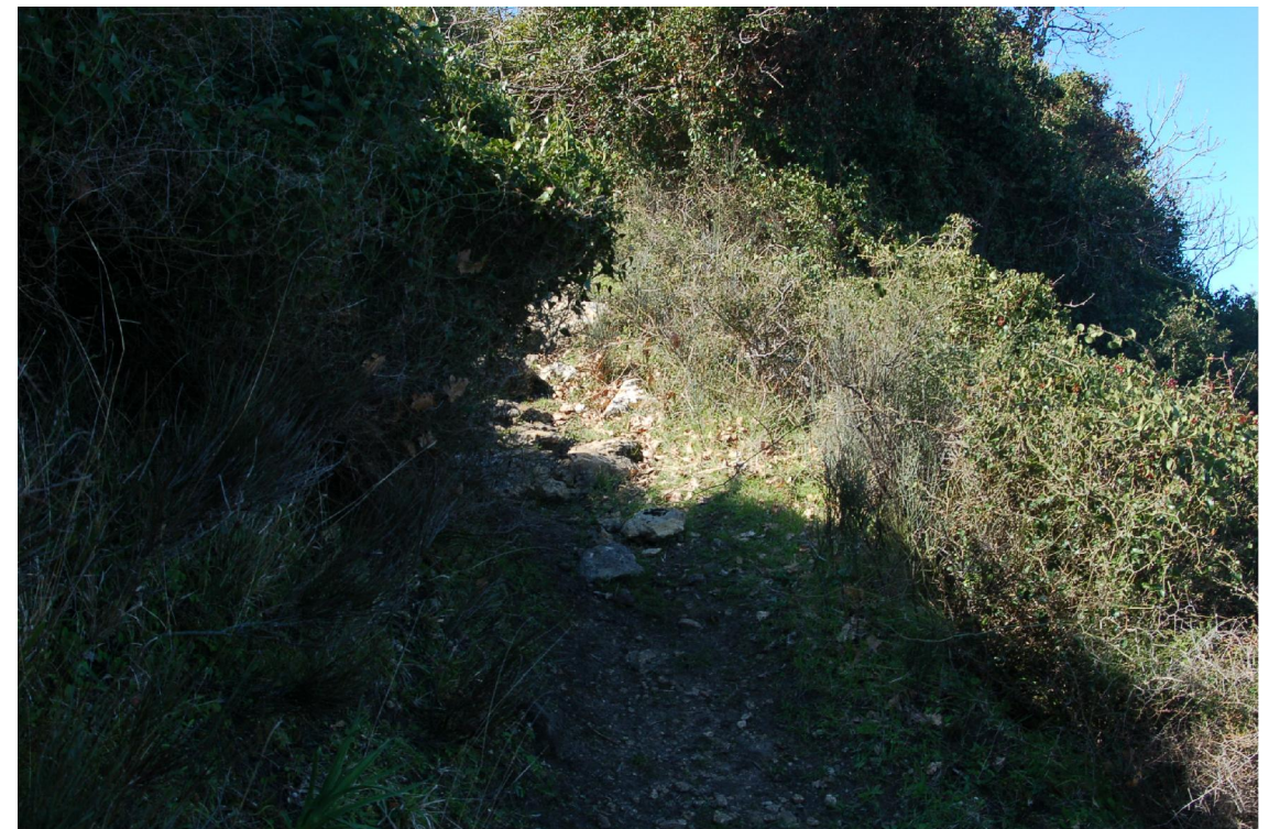
Foto 11 - Vista dello stradello nel tratto a mezza costa invaso da piante