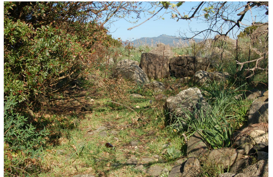
Foto 4 - Vista dei muri a secco di delimitazione