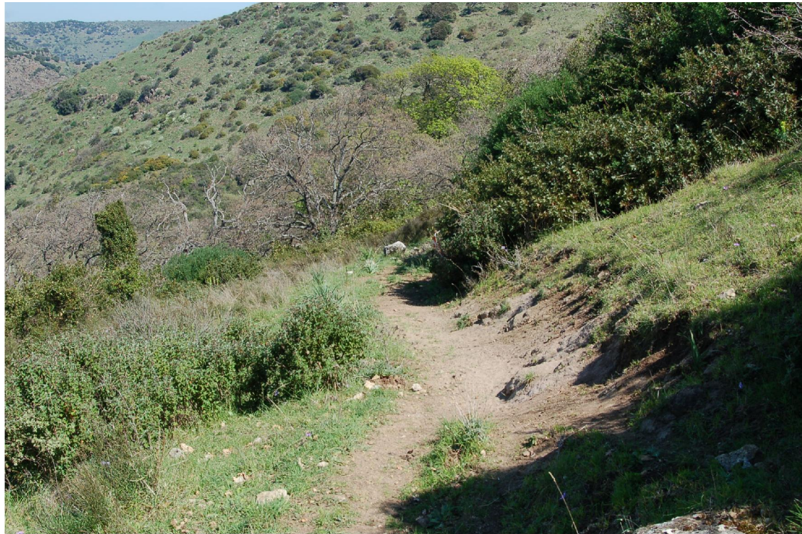
Foto 12 - Vista dello stradello nel tratto a mezza costa