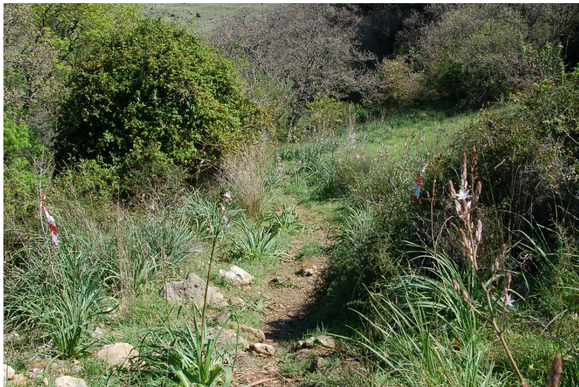
Foto14 - Vista dello stradello nel tratto quasi pianeggiante