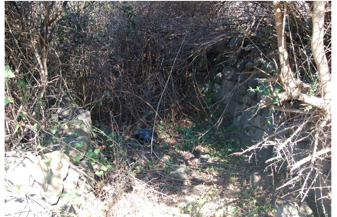
Foto 2 - Vista del primo tratto dello stradello invaso da piante infestanti