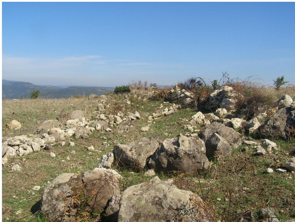
Foto 6 - Vista dei muretti di delimitazione a ridosso dell'area panoramica