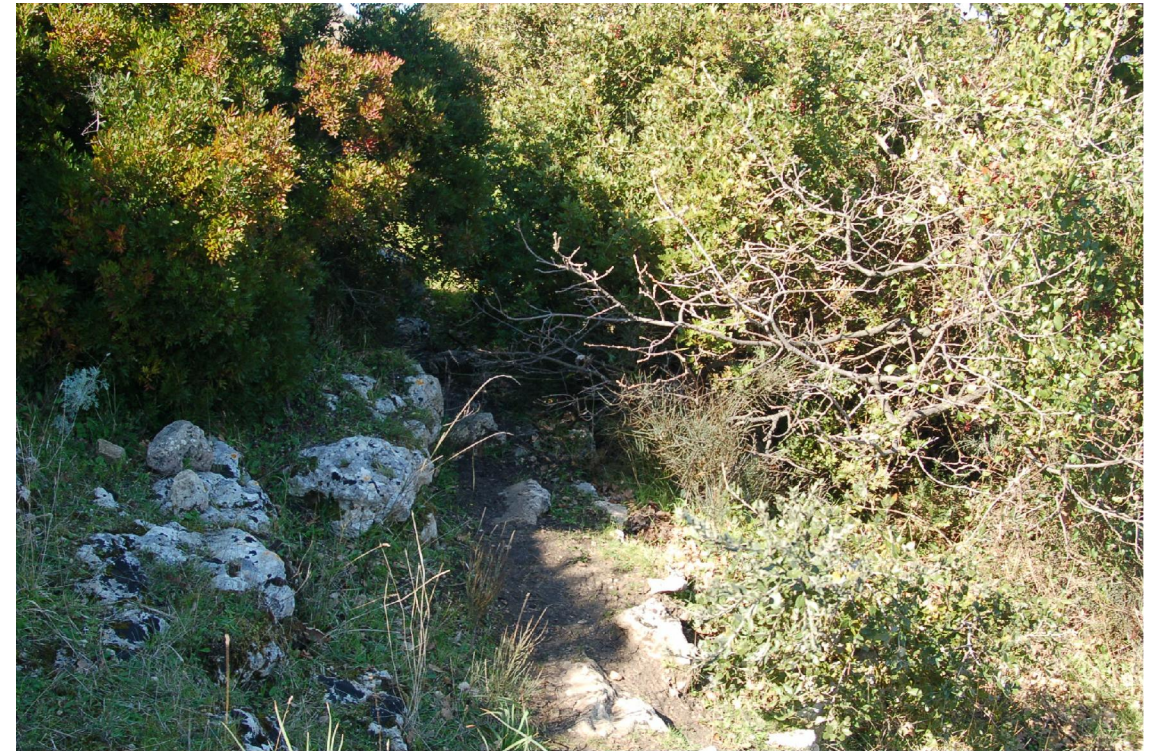
Foto 13 - Vista dello stradello invaso da piante infestanti e da massi